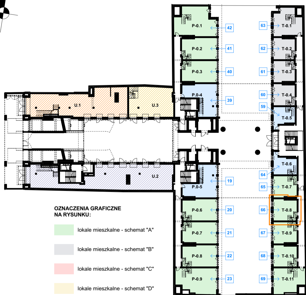
LOKALIZACJA LOKALU NA RZUCIE PARTERU skala 1:500