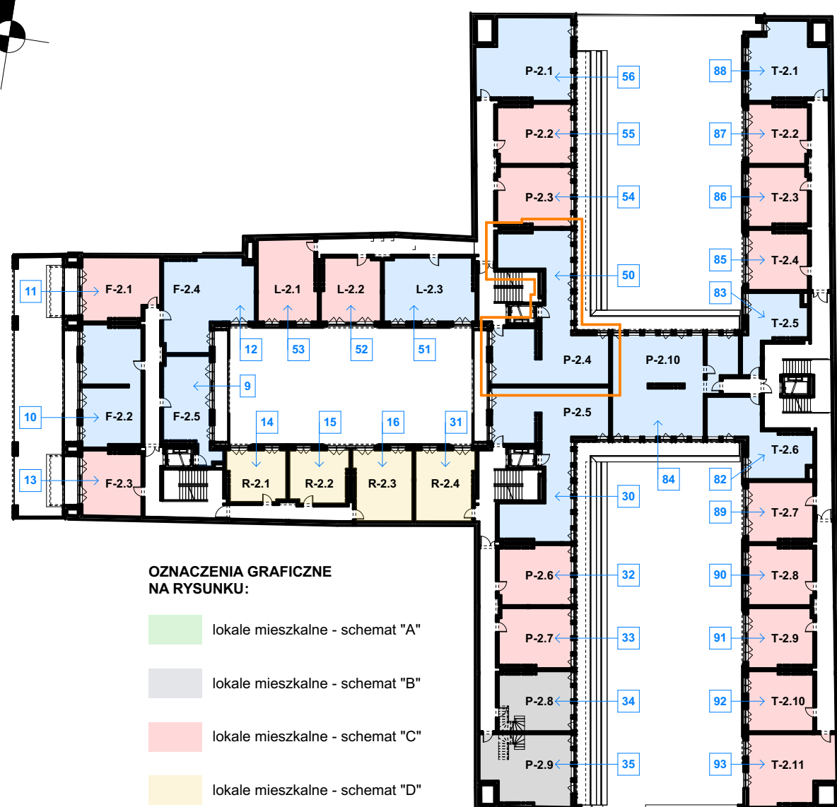
RZUT LOKALU skala 1:50