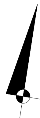
LOKALIZACJA LOKALU NA RZUCIE I PIĘTRA skala 1:500

POWIERZCHNIA WEWNĘTRZNA: 60,2 (w świetle wykończonych elementów konstrukcji) Powierzchnia dodatkowa: - balkon 13,5